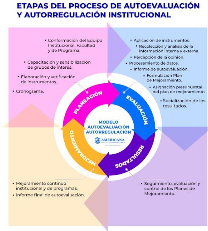
Figura 1. Etapas del Modelo de Autoevaluación y autorregulación Institucional.

Nota: La figura muestra las etapas del modelo de autoevaluación y autorregulación institucional.